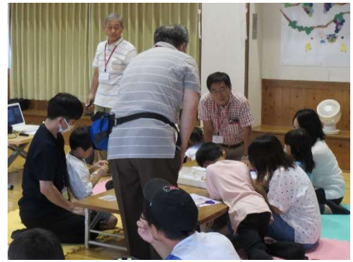
上手く作成するための指導風景