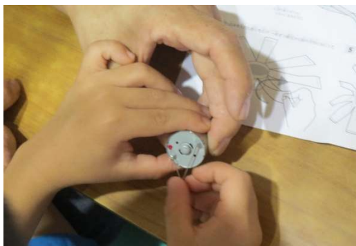
風車発電機の配線取り付け