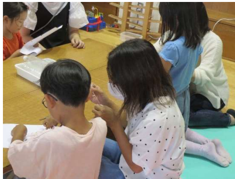
風力発電キットを確認する児童