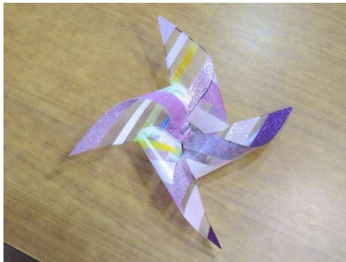
デザインされた風車