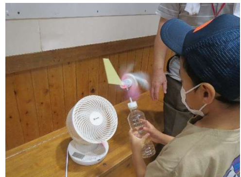
風車を持って回す児童